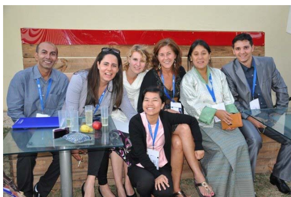
Electricity Museum - kolegové z Bangladesh, Dominican Republic, USA, Bhútán, Thailand, Algeria