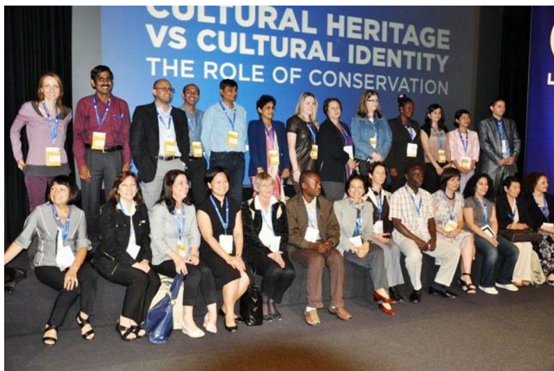
Konzervátoři, kteří získali cestovní granty

V rámci valného shromáždění a jednání aktivních členů ICOM-CC byl volen nový tým představenstva na další volební období a hlavním tématem byla diskuze o podpoře a spolupráci s mezinárodním střediskem ICCROM . Na konferenci ICOM-CC v Lisabonu bylo okolo 1.000 restaurátorů, konzervátorů a technologů různých oborů z celého světa. V letošním roce získalo 26 konzervátorů – členů ICOM podporu na cestování ve spolupráci s Getty Foundation , aby se mohli konference zúčastnit (viz obrázek).