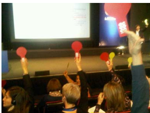
ICOM - CC Valné shromáždění