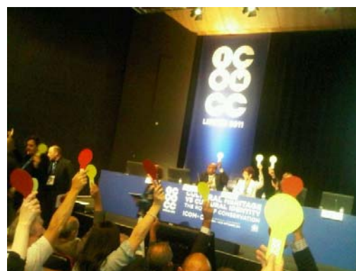
Volba pokračování spolupráce s ICCROM