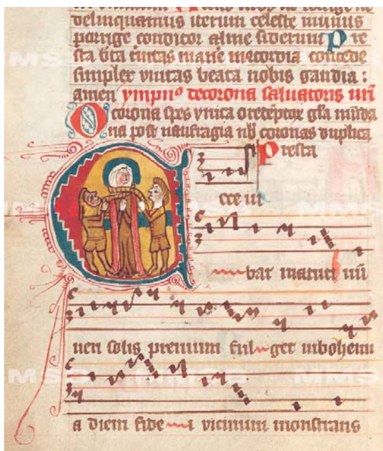
Uškrcení svatě Ludmily VI G 3a Corpus officiorum, fol. 67v

v postkomunistických zemích. První verze výstavy není konečná. Vyvinutá platforma je zatím pilotní a teprve „ostrý“ provoz umožní doladění finální podoby virtuální výstavy. Každý návštěvník se tedy může svými nápady a připomínkami spolupodílet na nové verzi výstavního formátu. Od 4. července se můžete vydat na báječnou cestu virtuálním světem hudby, stačí zadat internetovou adresu: http://www.manuscriptorium.com/a-slovo-se-stalo-hudbou a pro anglickou verzi pak: http://www.manuscriptorium.com/and-the-wo