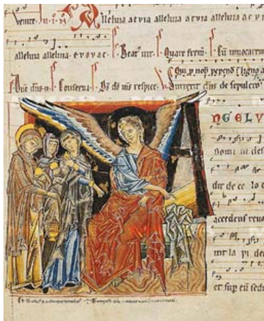
Tři Marie u hrobu XIII A 6 Sedlecký antifonář, fol. 173